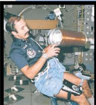
Tijdens de missie hield hij zich vooral bezig met de lading. Hier werkt hij in het ruimtelaboratorium.