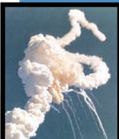
De vlucht met de Challenger na die van Ockels liep dramatisch af. De Space Shuttle ontplofte.