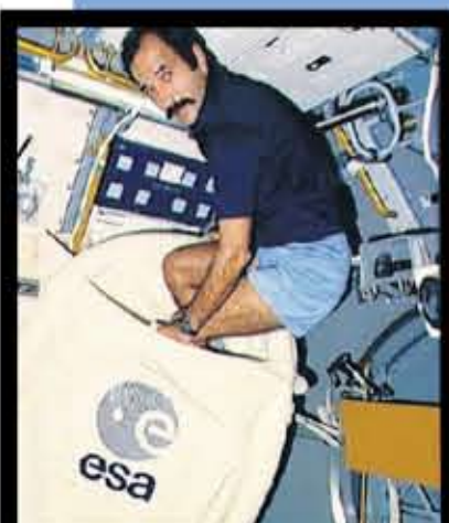
De astronaut kruipt aan boord van het internationale ruimtestation in een speciale ruimteslaapzak.